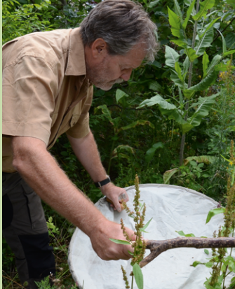
Recherche zoologique : collecter des araignées avec le parapluie japonais