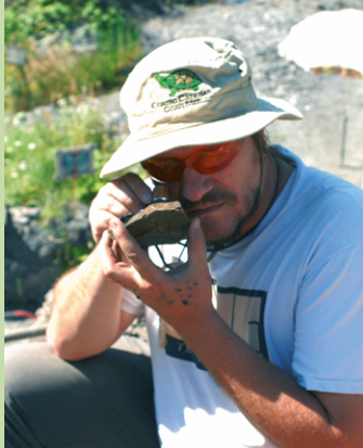
Recherche paléontologique : fossiles vus de près